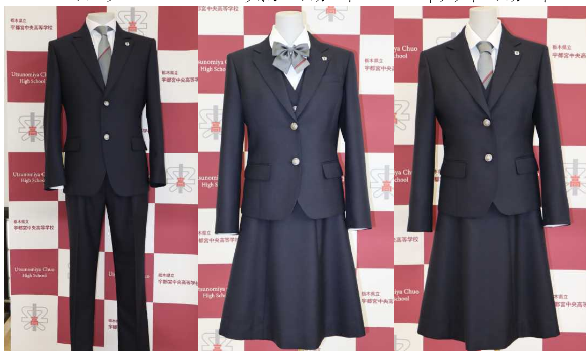
ネクタイ・スカート