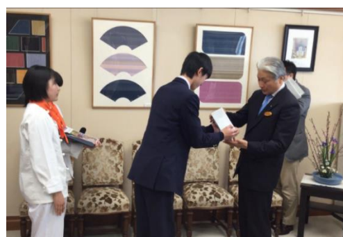
色紙・花瓶などの記念品をお渡ししました