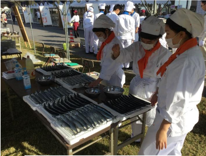
さんまの良さを引き立たせる塩加減