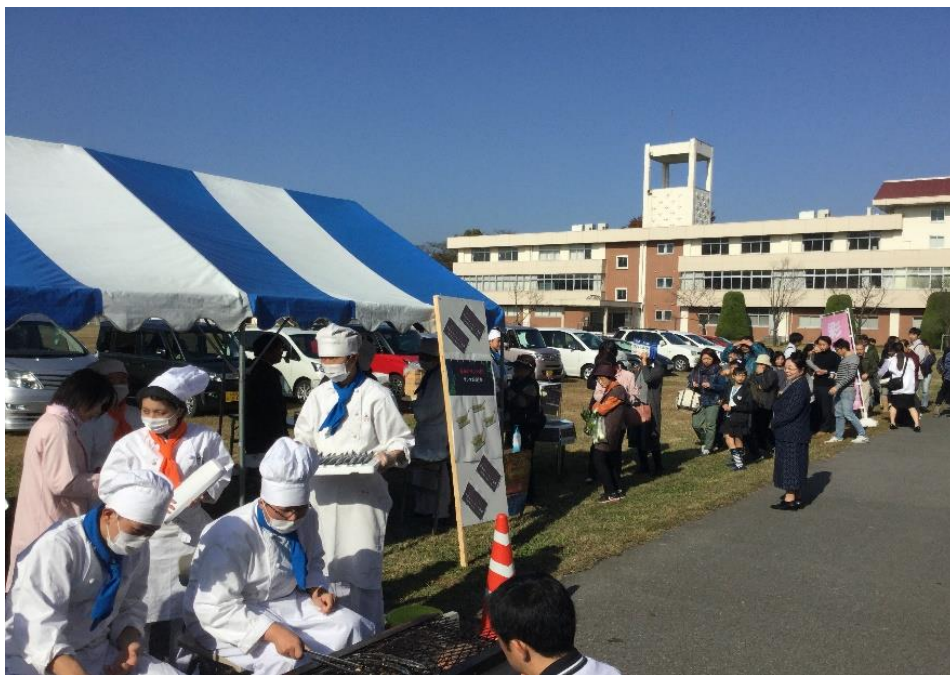
イベント開始前から列ができ、大盛況でした